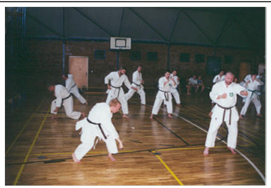
Kushanku links geordnet - und rechts?

Und was geschah am nächsten Tag? Das seht ihr in der Ausgabe 11