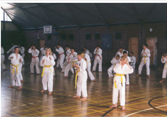
Hier üben unsere Karate - Kids mit rauchenden Köpfen die KATA Dresden,